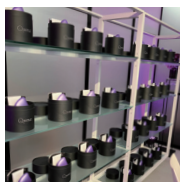
プレス発表会の会場

2024年2月27日より、一般消費者向けブランド「JMEC be」より、たるみ治療に着想を得た家庭用の肌ひきしめ美顔器が新発売となります。発売に先駆けて催したプレス発表会では、多くの美容ライターや美容家が来場し、これまでにない体感に驚かれ、高い期待と注目を集めました。