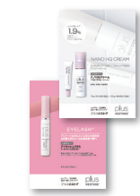
患者様向けパンフレット (パンフレットスタンドもあります)