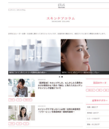
公式ブランドサイト

患者様の目に触れやすいプラスリストア公式サイトへの取扱施設一覧に掲載できます。 掲載は無料です。