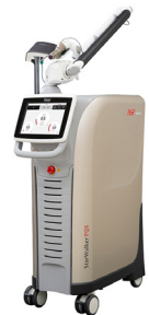
ピコ秒 Nd:YAG レーザー PQX Pico Laser