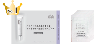
TA クリーム サンプル<美白クリーム>