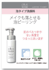
院内用ポスター (A3・A4)